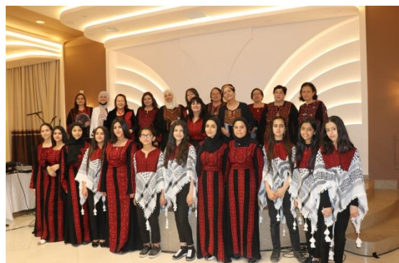
A school choir (in front) together with the Bethlehem Sumud Choir